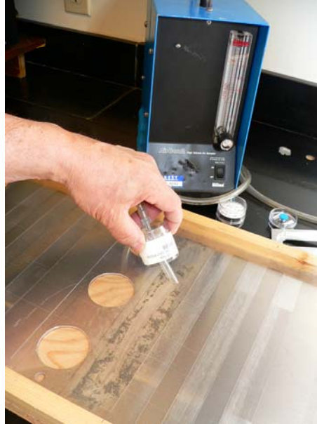
Figure 4 : Méthode de l'ASPEC