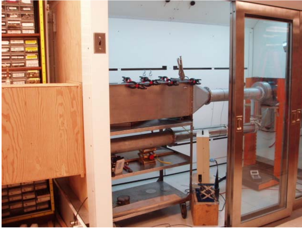
Figure 1 : Chambre d'empoussièrement actuelle