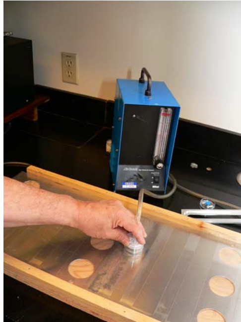
Figure 3 : Méthode de la NADCA

Trois méthodes de prélèvement ont été évaluées dans la chambre d'empoussièrement. La première est celle de la NADCA (4). Elle consiste à aspirer les poussières sur une surface de conduit prédéfinie de 100 cm 2 (2 surfaces de 50 cm 2 ) à partir d'un gabarit de 0,381 mm d'épaisseur et à les recueillir sur une membrane pré-pesée en esters de cellulose de 0,8 µm de porosité montée dans une cassette ouverte de 37 mm de diamètre (SKC Inc. Eighty Four, PA, USA) (Figure 3).