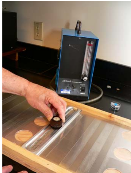
Figure 5 : Méthode de l'IRSST

Les avantages et inconvénients de ces trois méthodes sont mentionnés au tableau 2.