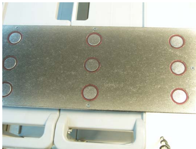
Figure 2 : Répartition des substrats témoins

Douze substrats témoins (filtres en aluminium de 47 mm de diamètre, MSP Corp., Shoreview, MN, USA) répartis stratégiquement sur la surface du radier ont été pris à chaque essai d'empoussièrement. Un gabarit recouvrant entièrement le fond de l'enceinte permettait d'insérer des filtres témoins et de s'assurer qu'ils ne perturbaient pas l'écoulement. La figure 2 présente leur disposition sur la plaque.